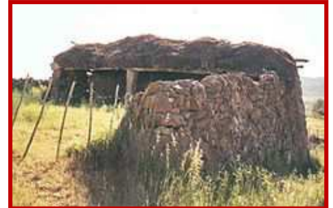
Tinao para resguardar carros de bueyes o aperos de labranza.

Es por tanto un modelo típicamente ganadero que orienta sus corrales de entrada sur-sureste, con tapia baja o de media altura y acceso a través de portones, que constituyen su elemento arquitectónico más característico.